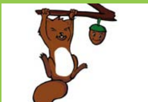
Und unsere Maskottchen Cosmo und Liu