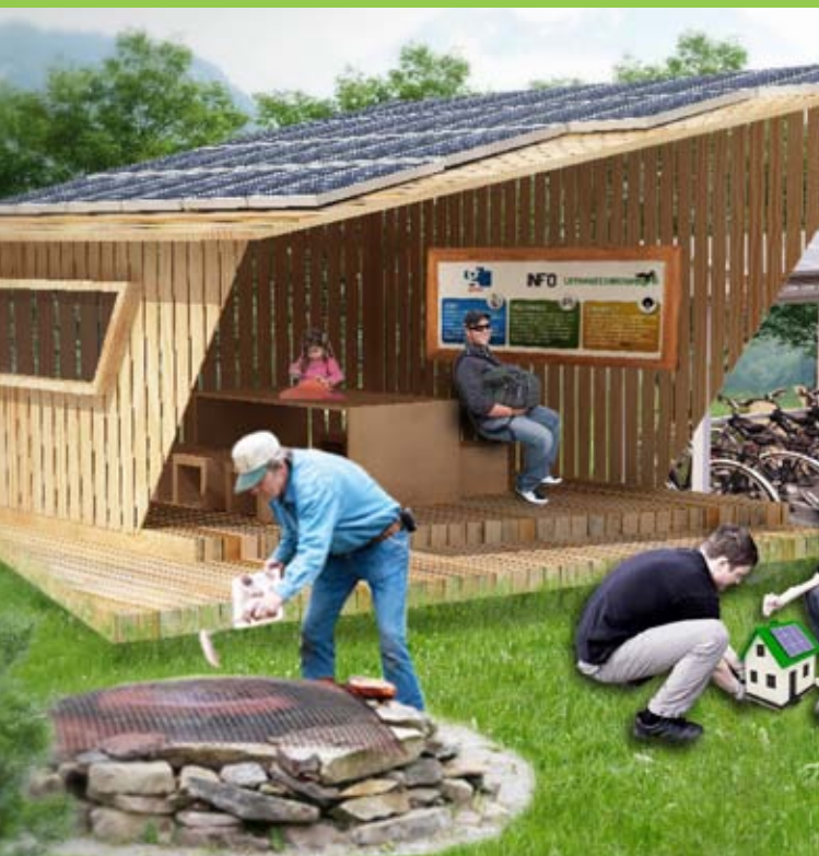
Simulation einer Station (kein endgültiges Design)

Langfristiges Ziel ist es, bestehende Velorouten in verschiedenen Regionen der Schweiz zu erlebnisreichen und zukunftsweisenden Umweltvelowegen auszubauen.